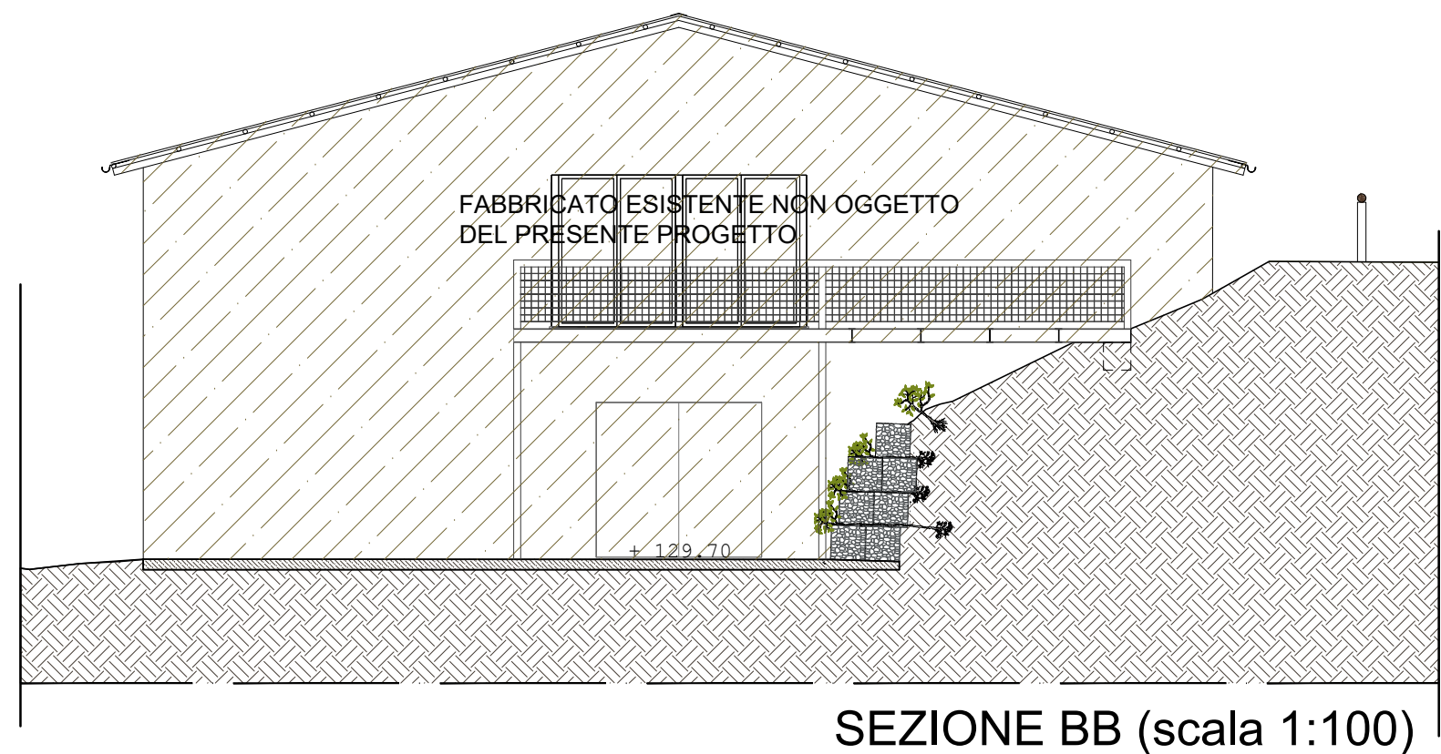
SEZIONE BB (scala 1:100)