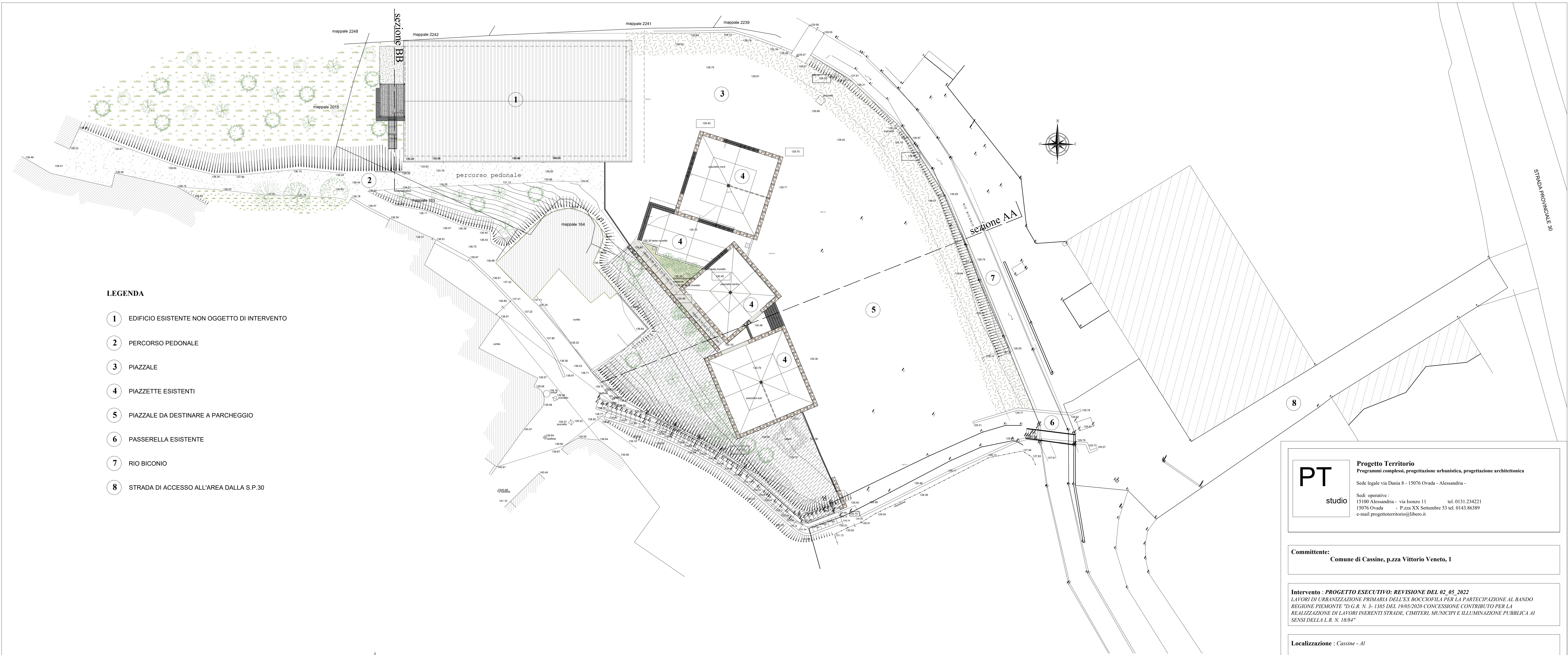
PLANIMETRIA GENERALE (scala 1:200)